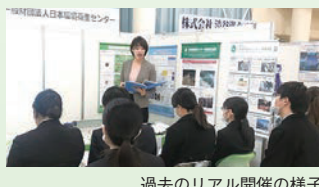
過去のリアル開催の様子