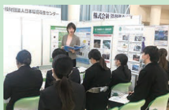
過去のリアル開催の様子

開催日: 2024年3月6日 (水) 12:00~17:00 オンライン参加学生: 43大学49学科 101名